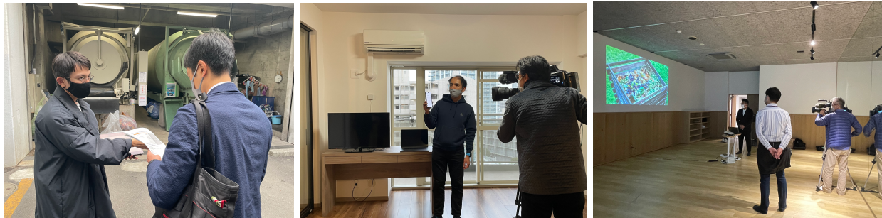
右:レコテック株式会社、中央:Nature株式会社、左:株式会社komhamの取り組み紹介